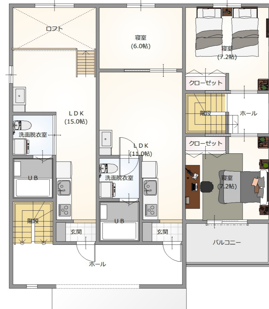
2st FLOOR S:1/100